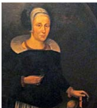
Stormor i Dalom

Välkomna till Härnösand. Deltag i ättingaträffen, ett intressant evenemang med omväxlande och innehållsrikt program! Anmälan görs på vår hemsida.