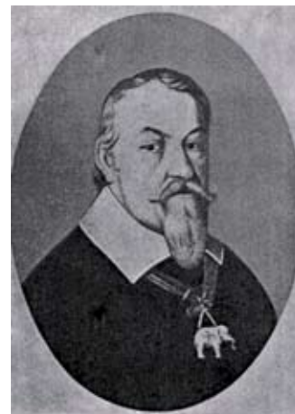
Kansler Jens Bjelke på Austrått